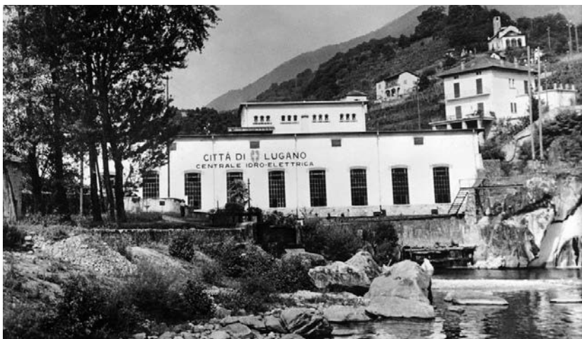
La "vecchia" centrale in funzione dal 1907 al 1967.