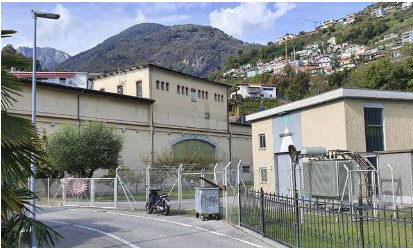
La "vecchia" centrale oggi, con a destra lo stabile della nuova centralina.

L'interno della centralina, con una turbina, il generatore e la ruota di riserva, e sotto i rispettivi dati tecnici.