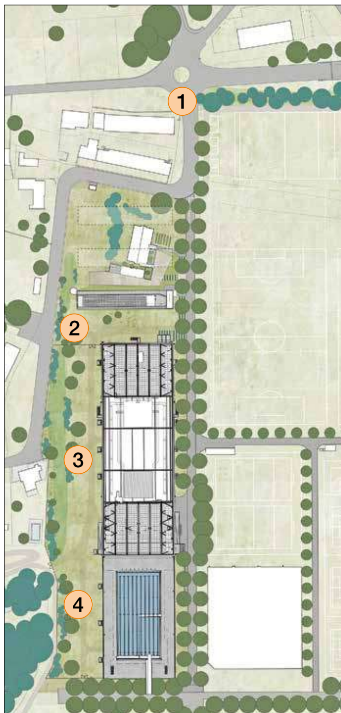
CST 5a Tappa: situazione generale