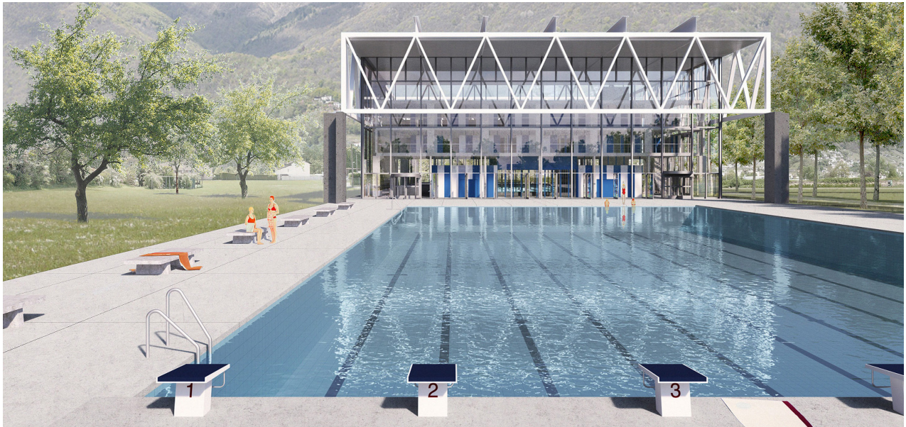
Visualizzazione del progetto di concorso “nuove piscine CST”. Prospettiva dalla piscina esterna sulla piscina coperta.