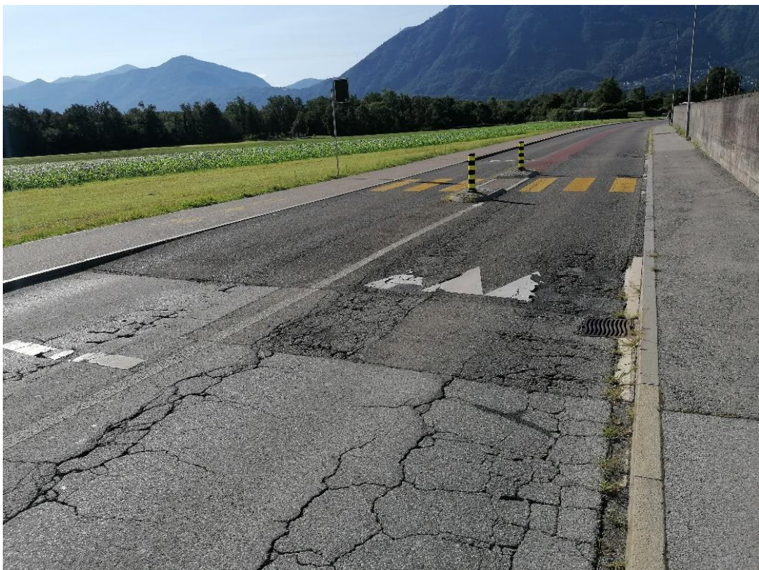
Figura 2: Via Brere vista verso Sud - 1