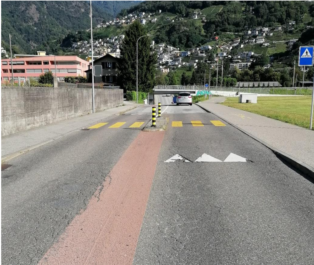
Figura 1: Via Brere vista verso Nord