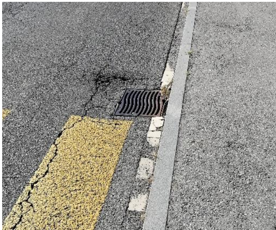
Figura 4: Abbassamento caditoie