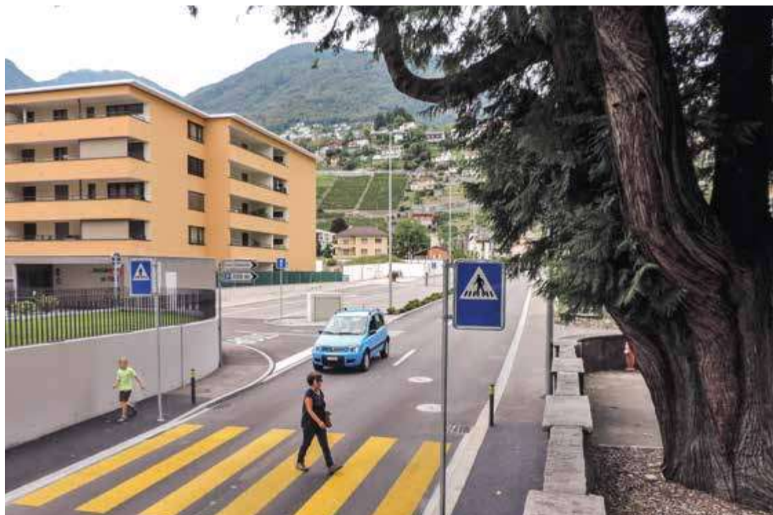
Il nuovo passaggio pedonale su via alla Stazione.

Il Municipio ha deliberato allo studio d'architettura Guscetti di Minusio il progetto di massima per la riqualifica urbana di via San Gottardo e di via Stazione. Se il progetto sarà accettato dalla Confederazione e dal Cantone, entrerà a far parte delle opere finanziate dal Programma d'agglomerato del Locarnese.