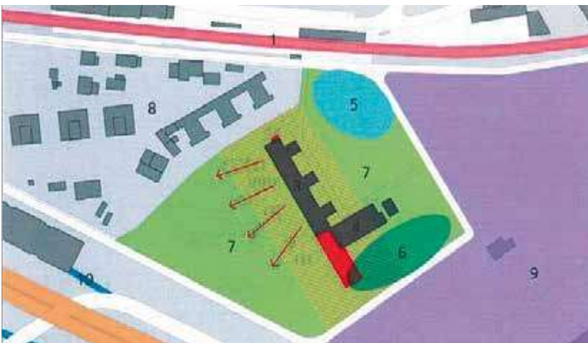
In rosso una possibile soluzione di ampliamento dell'edificio scolastico esistente.

Il Municipio sarebbe disponibile a procedere all'allargamento di altre tratte della strada per Contra. Dal Cantone non ci sono però ancora riscontri.