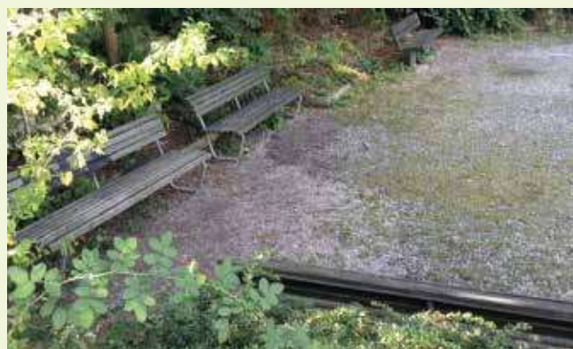
▲ Rilassante parco cittadino. Alberi e arbusti a foglia caduca danno ombra in estate e lasciano passare i raggi del sole in inverno.