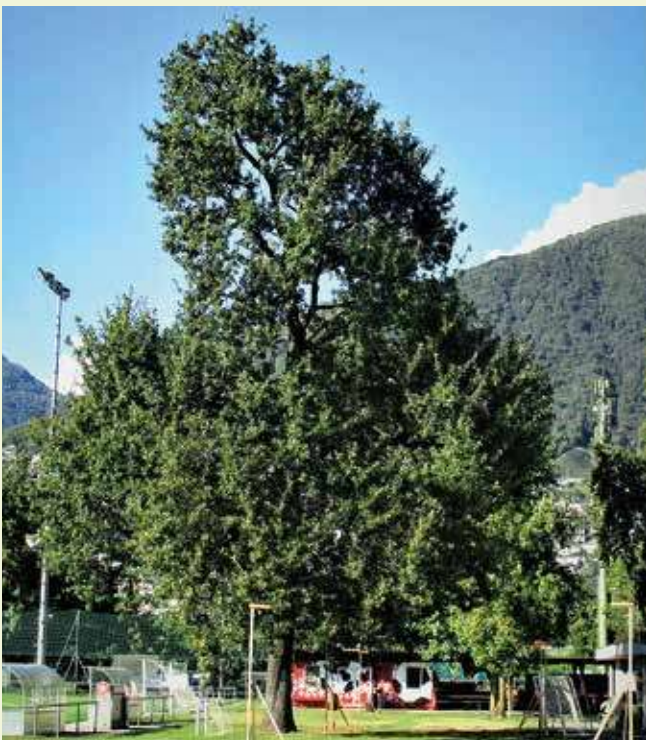
Grande quercia presso il campo da calcio, fra le più belle del Comune. Le modine a ridosso dell'albero fanno a giusta ragione temere il peggio. In presenza di un conflitto fra albero ed edificio ha finora sempre vinto l'edificio: non dovrebbe essere necessariamente così.

dell'aria, in quanto, per esempio, filtrano le pericolose polveri fini. Il clima si è riscaldato, il caldo urla e continuerà a farlo. Il problema delle estati torride si farà acuto, con ripercussioni sul benessere e la salute. Vale anche per Tenero-Contra, comune ben esposto al sole. Un solo albero giornalmente immette nell'aria sorprendenti volumi d'acqua, con corrispettivo effetto rinfrescante sui dintorni. L'ombra degli alberi sarà sempre più ricercata. L'ombra giusta nel luogo giusto, è quanto s'impone, la leggera ombra di una betulla, l'ombra fredda del frassino, quella densa di un faggio o ippocastano. E la bellezza degli alberi, il piacere che ci procurano? Con la loro infinta varietà di forme e colori, la loro individualità e potenza, gli alberi sono semplicemente belli. Al loro cospetto percepiamo tuttavia che c'è più che solo bellezza; c'è dell'altro, una realtà