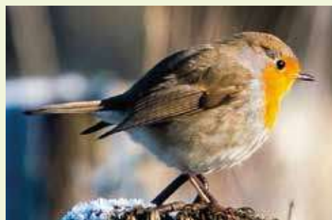
▲ Pettirosso: gli alberi sono indispensabili agli uccelli.