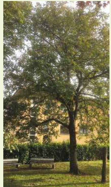
▲ Noce presso l'Oratorio Don Bosco.