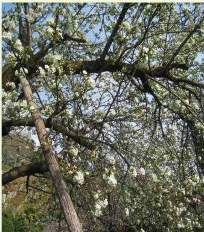
▲ Melo in fiore a Contra. Un ramo è sostenuto da un palo, segno di attaccamento all'albero. Ora non c'è più, ha dovuto lasciare posto da un edificio.

Le estati sempre più torride per via della distruzione del clima suggeriscono misure atte a migliorare gli effetti mitiganti della vegetazione. L'ombra degli alberi assume sempre più importanza, come già detto. Ci vuole un piano d'azione comunale per fronteggiare per quanto possibile il caldo estivo, sulla linea di altri comuni, con una revisione perlomeno parziale del Piano regolatore comunale. Uno dei molti esempi cui ispirarsi è quello di Sion ( www.sion.ch/acclimatasion ). Il patrimonio di alberi presente può costituire una buona base di partenza, premessa una collaborazione con i proprietari. Si hanno dunque tre settori a cui è necessario prestare molta attenzione: quello della biodiversità, quello degli effetti del clima che si deteriora e quello di tenere bello il Comune. Cosa dire in sintesi? Più alberi, più cespugli!