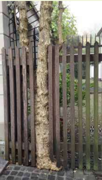
▲ Arbusto amorevolmente integrato in un cancello.