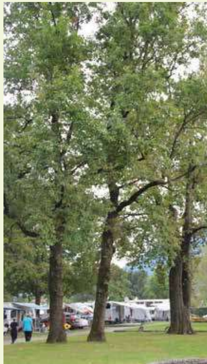
▲ Stupende querce nei campeggi. Complimenti ai proprietari che hanno saputo preservarle.