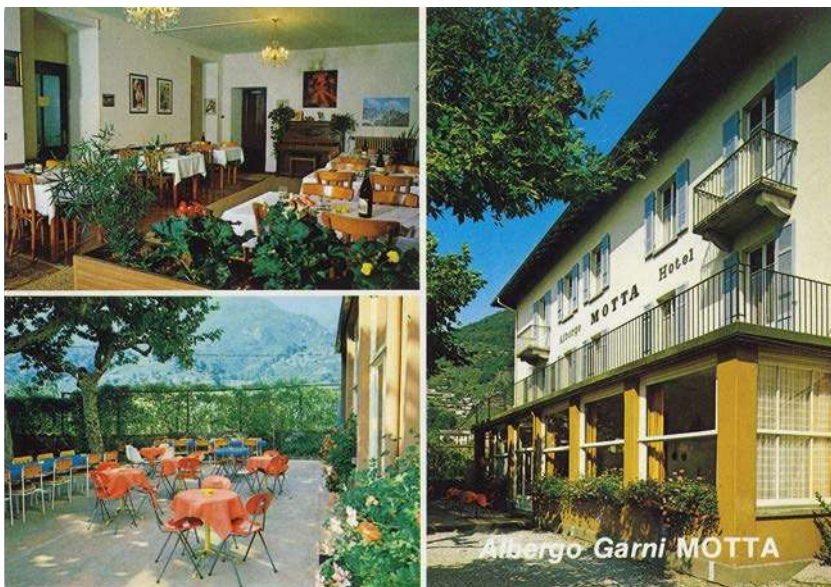
L'albergo Motta negli anni '70. Fu demolito nel 2014.